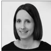
Gygax Lilian Administration